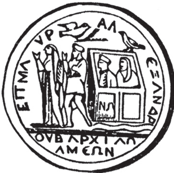
Moneda frigia en la que se representa el arca (201 a 210 después de Cristo), durante el reinado del emperador Septimio Severo.